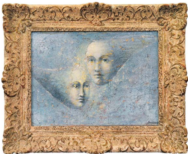
Le couple , 62 × 51 cm, Huile sur toile The couple , 62 × 51 cm, Oil on canvas 2003