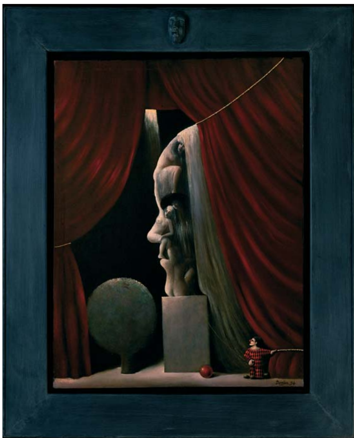
Le Clown, 90 × 110 cm, Huile sur toile The Clown, 90 × 110 cm, Oil on canvas 1994