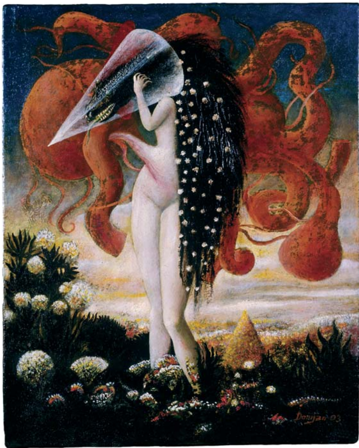
Maternité, 48 × 56 cm, Huile sur toile Motherhood, 48 × 56 cm, Oil on canvas 2003