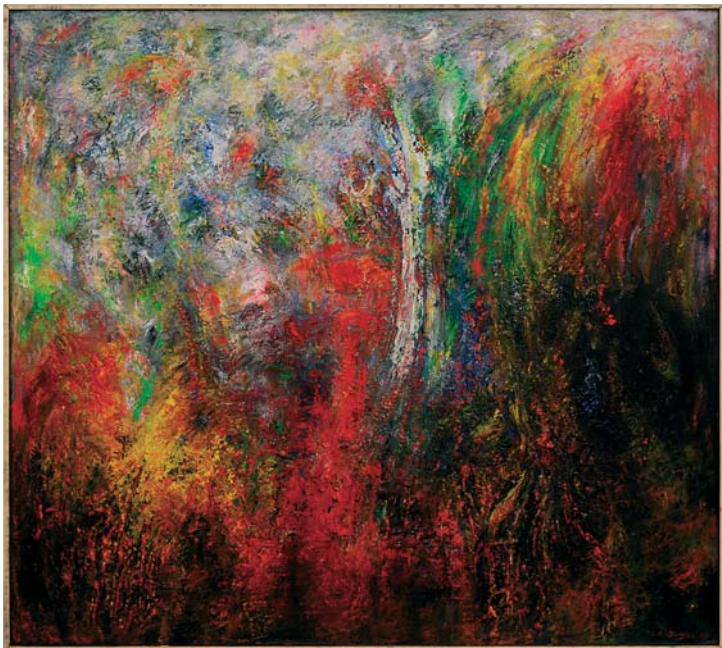
Étude de la forêt n°1, 157 × 142 cm, Huile sur toile Study of the forest 1, 157 × 142 cm, Oil on canvas 2007